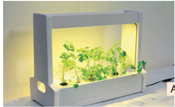
Akarina06 ¥ 14,700