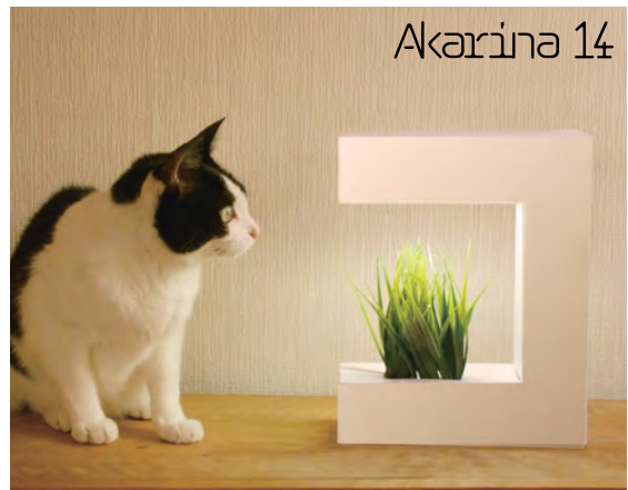
Akarina 14 ¥ 8,500