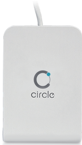
ICカードリーダーライター