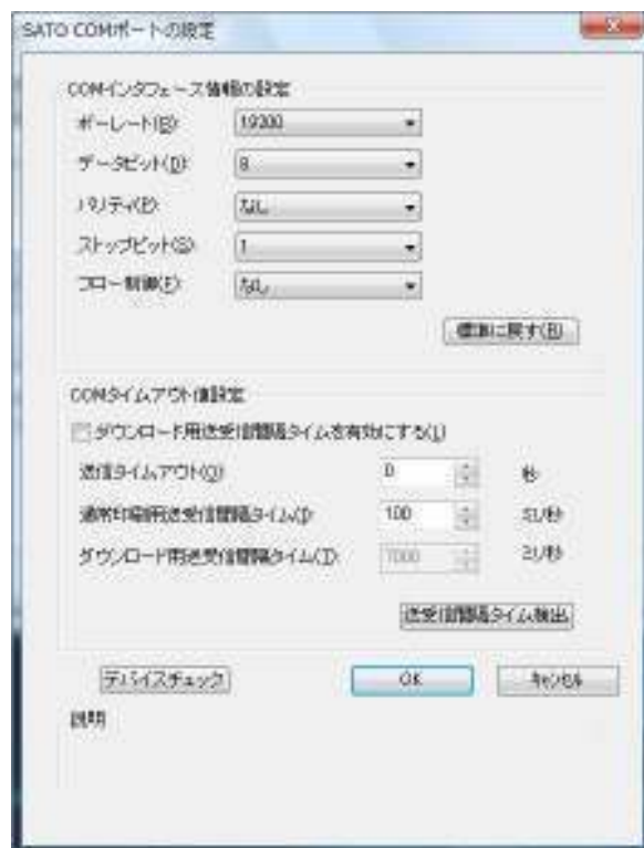
図3 「SATO COMポートの設定」画面

④ 例えば、ポートの設定を変替する場合、図2の「ポートの構成(C)」をクリックします。図3の「SATO COMポートの設定」画面が表示されますので、必要に応じて設定変替を行ってください。