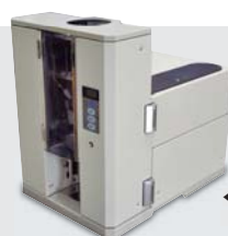
◀ ハルン(尿)カップラベラー