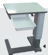
◀ 車椅子対応電動昇降台