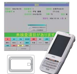
巡回健診支援システム T-MES