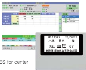
健診データ収集システム T-MES for center